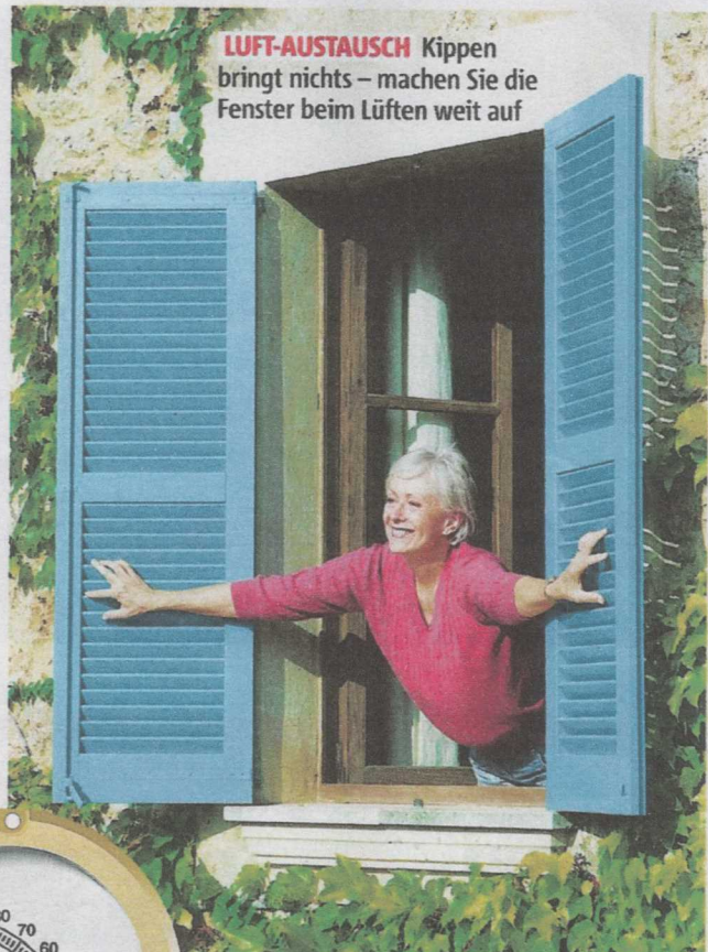
LUFT-AUSTAUSCH Kippen bringt nichts – machen Sie die Fenster beim Lüften weit auf

Sorgen Sie mindestens zwei Mal am Tag für einen Luftaustausch. Das bedeutet: Stoßlüften. Die Fenster nicht kippen, sondern für einige Minuten weit aufreißen. Generell gilt: Je niedriger die Zimmertemperatur, desto häufiger müssen Sie lüften. Während des Lüftens drehen Sie die Heizung ab,